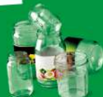
POTS ET BOCAUX EN VERRE