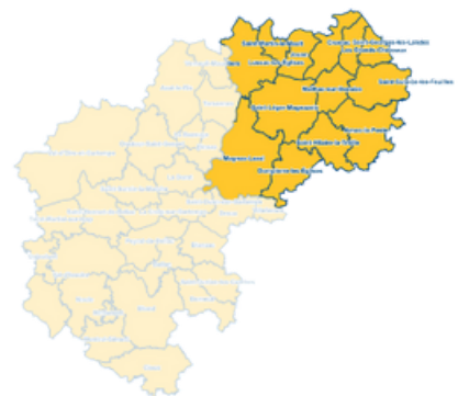
SECTEUR 3 : ST-SULPICE-LES-FEUILLES 6 831 habitants