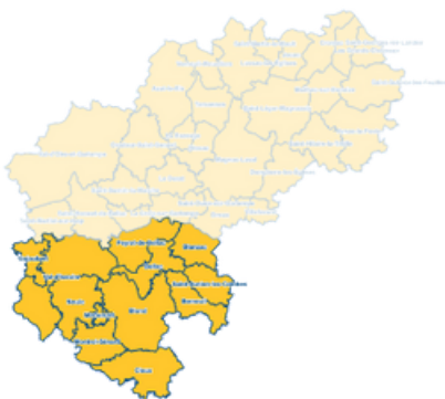
SECTEUR 1 : BELLAC 8111 habitants

Calidris entamera dès l'été 2024, une cartographie détaillée de la biodiversité, identifiant les enjeux cruciaux de préservation et de protection.