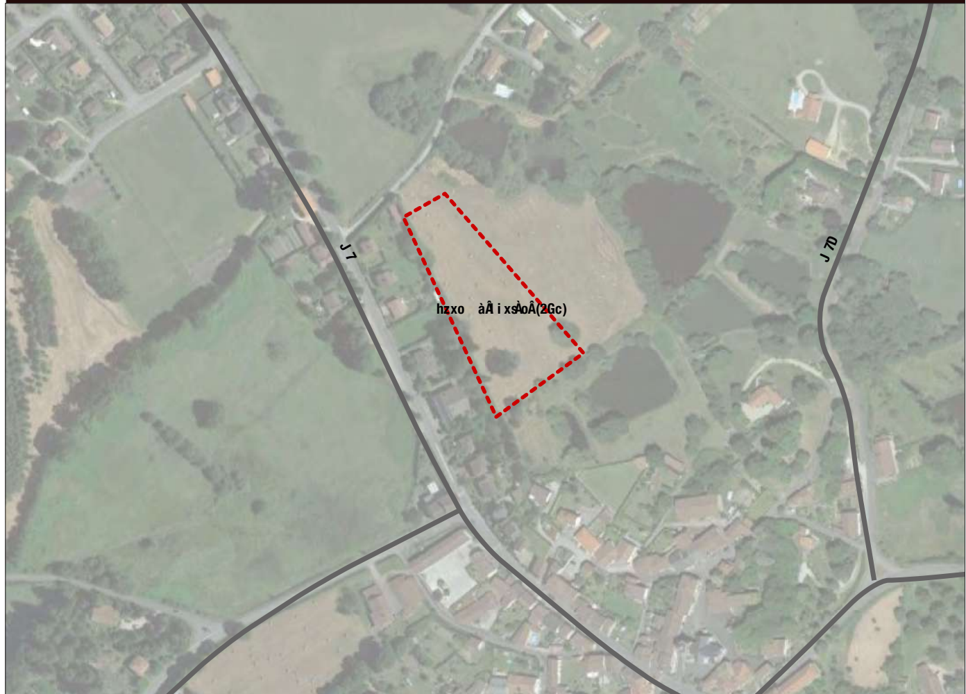
I UTblf bl Jc aRl JL RG hUTL 2Gc

l xq zxq fièm rté q tv àum qm dzèp p nz èr